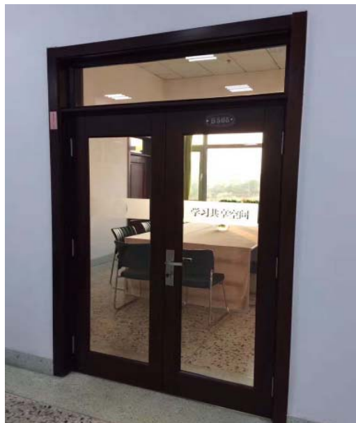
B楼5层学习共享空间

一直以来，校领导高度重视图书馆的发展，在视察图书馆时提出增加阅览座位，为读者提供优质服务的建议。在校领导的大力支持下，暑假期间图书馆新购进阅览桌210张、阅览椅850个。目前，所有桌椅已全部到位，分别安放在A楼6层和B楼2层、5层阅览区和自主自习区。同时，图书馆对B楼5层进行了布局调整，原报刊阅览区并入B楼4层单本书、工具书阅览区；新增多媒体教室1个；学习共享空间3个。新学期伊始，多媒体教室及各功能阅览区全部投入使用，