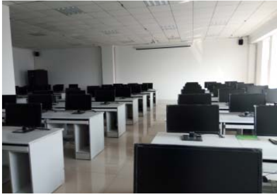
B楼5层新增多媒体教室