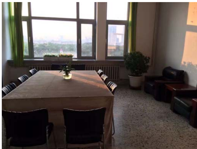
B楼5层学习共享空间